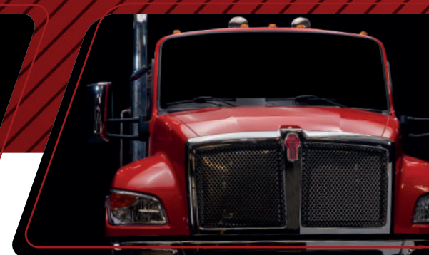
Parabrisas amplios para mayor visibilidad