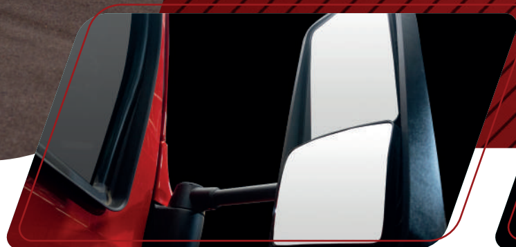
Espejos robustos y montados a la cabina para mayor durabilidad

El capó es más corto con la cabina DayCab, sus parabrisas, ventanas laterales más amplias y espejos estratégicamente colocados, y su gran iluminación de los faros mejoran la visibilidad del conductor facilitando maniobrar con seguridad y reaccionar oportunamente ante algún imprevisto.